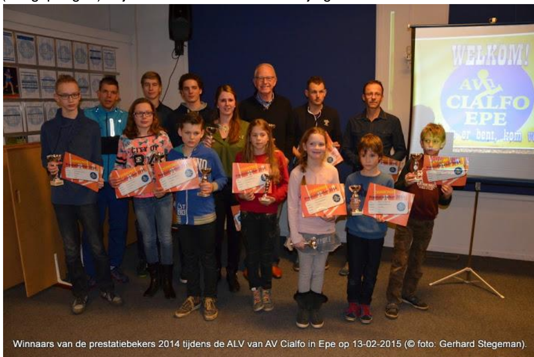
Winnaars van de prestatiebekers 2014 tijdens de ALV van AV Cialfo in Epe op 13-02-2015.